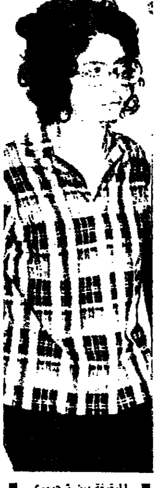
الموتوة بين شحوري